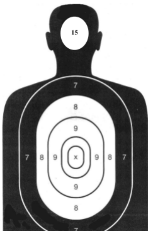
TERČ „HONZA A3“